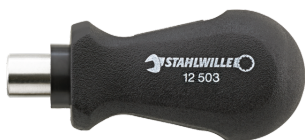
18110016 Uchwyt do bitów