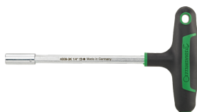
18093016 Uchwyt do bitów