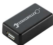
52110061 Adapter interfejsu