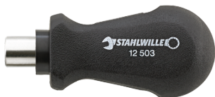
18110016 Soporte de puntas