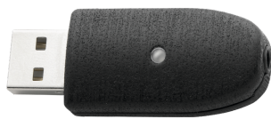
52111057 Adapter USB