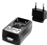
52110063 Zasilacz sieciowy USB