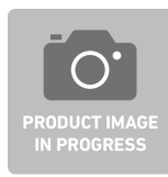
83230103 Inserti in schiuma morbida