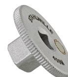
11030010 Douille à choc