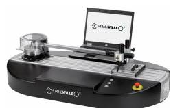
52111192 Installation d'étalonnage