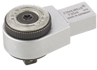
58250004 Feinzahn- Einsteckknarre