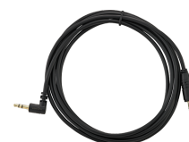
52110052 Cavo a spirale