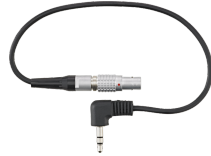
52110058 Jack-plug Lemo-kabel