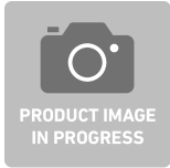
83585224 Inzetstuk voor gereedschapsassortiment