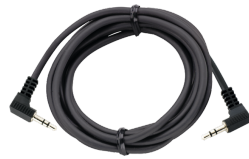
52110051 Kabel met jack-plug