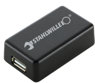
52110061 Adattatore di interfaccia