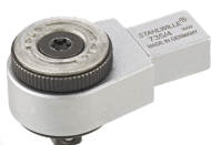
58250004 Grzechotka wtykowa z drobnymi zębami