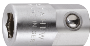
11180020 Soporte de puntas