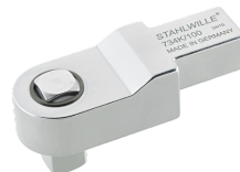
58243004 Kalibratie- insteekvierkant