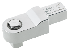
58243005 Kalibratie- insteekvierkant