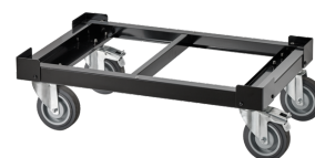
81200158 Bastidor con ruedas