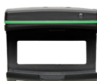
52110220 Bluetooth Low Energy modul 714