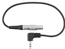
52110058 Jack-plug Lemo-kabel