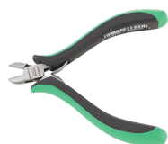
67086000 Mini-pince coupante diagonale pour l'électronique