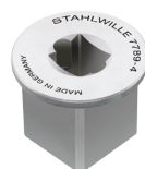
58524090 Adaptador cuadrado