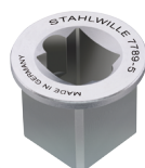
58524091 Adaptador cuadrado