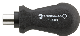
18110016 Soporte de puntas