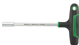
18093016 Soporte de puntas