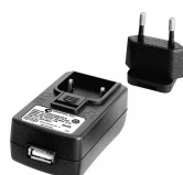
52110063 Fuente de alimentación USB