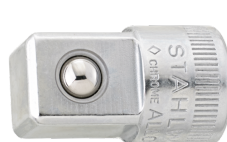
11030003 Douille à choc