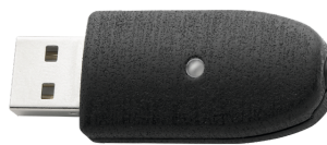
52111057 Adaptador USB