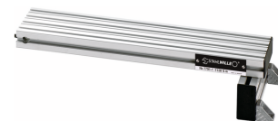
52110191 Alargadera para refs. 7791, 7794-1 y 7794-2 hasta 1.000 N-m