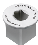
58521088 Adaptador cuadrado