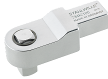
58243020 Kalibratie- insteekvierkant