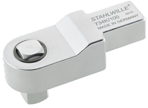
58243040 Kalibratie- insteekvierkant