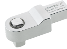
58243004 Kalibratie- insteekvierkant