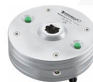
96524300 Trasduttore da laboratorio