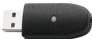
52111057 Adattatore USB