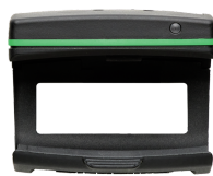
52110220 Bluetoothmodule für Drehmomentschlüssel