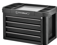
81200157 Cassetiera Convertibile