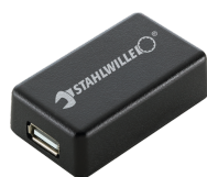
52110061 Adattatore di interfaccia