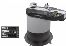
96521094 Automatisk kalibrerings- og justeringsanordning fra 1-400 N·m