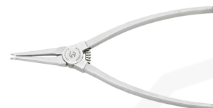
65454101 Pince à circlips p.bagues extérieures