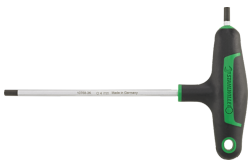
43253040 Tournevis à poignée en T