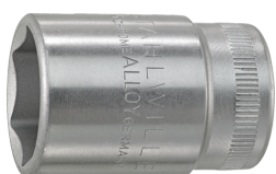
03030017 Douille pour tournevis