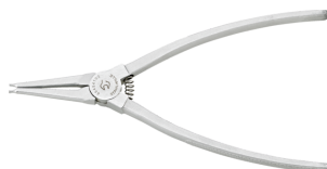
65454102 Pince à circlips p.bagues extérieures