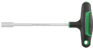
43233080 Clé à douilles hexagonale