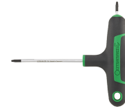
43293009 Tournevis TORX