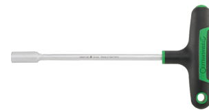
43233100 Clé à douilles hexagonale