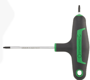
43293045 Tournevis TORX