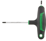
43293015 Tournevis TORX