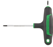
43293010 Tournevis TORX