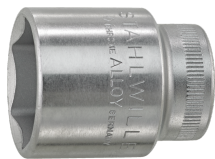
02110008 Douille pour tournevis