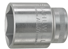
02110010 Douille pour tournevis