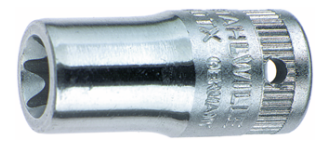
01270008 Douille pour tournevis