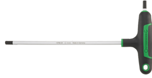
43253060 Tournevis à poignée en T