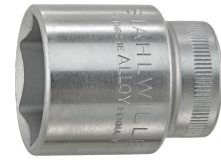
02110018 Douille pour tournevis