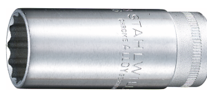
02020208 Douille pour tournevis