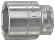
02110021 Douille pour tournevis