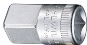
12030003 Douille à choc