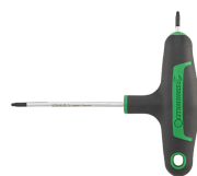
43293030 Tournevis TORX