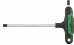
43253080 Tournevis à poignée en T