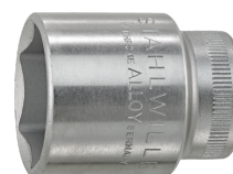
02110022 Douille pour tournevis