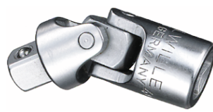
11020000 Joint de cardan