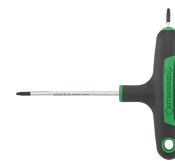
43293050 Tournevis TORX