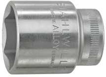
02110017 Douille pour tournevis