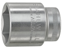
02110013 Douille pour tournevis