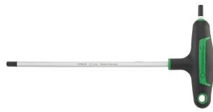
43253030 Tournevis à poignée en T