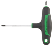
43293020 Tournevis TORX