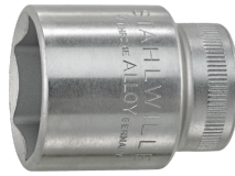
02110019 Douille pour tournevis