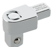
58240010 Attacco quadro a innesto