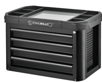
81200157 Cofre para herramientas