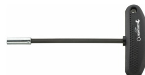
18090016 Tournevis à embout