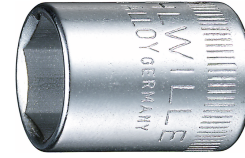
01010006 Douille pour tournevis