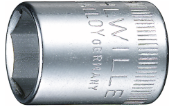
01010008 Douille pour tournevis