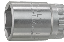
03030027 Douille pour tournevis