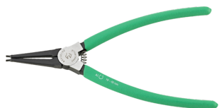
65456102 Pince à circlips pour bagues extérieures