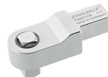
58243020 Attacco quadro a innesto di calibrazione