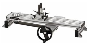
52110091 Dispositivo di calibrazione meccanica fino a 400 Nm