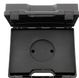
81500003 Cassetta in plastica, vuota