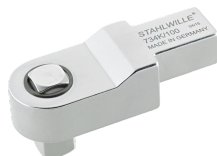
58243040 Attacco quadro a innesto di calibrazione