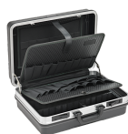
81620009 Maletín de herramientas