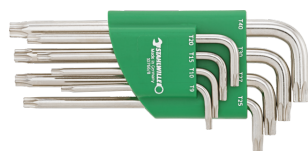
96432200 Set de tournevis coudés