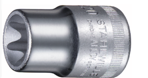
03270020 Douille pour tournevis