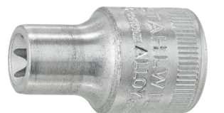
02270014 Douille pour tournevis