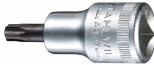
03100060 Douille pour tournevis