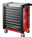
81200168 Carro de taller