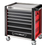
81200171 Carro de taller