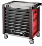
81200174 Carro de taller