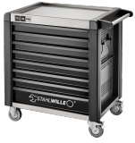
81200172 Carro de taller