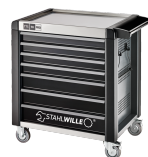
81200169 Carro de taller