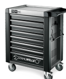
81200166 Carro de taller