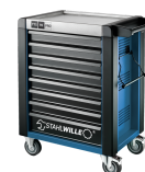
81200167 Carro de taller