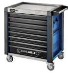
81200173 Carro de taller