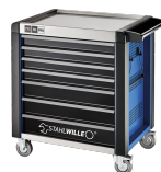
81200170 Carro de taller