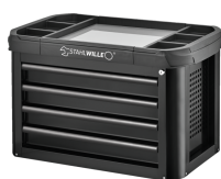
81200157 Coffre à outils