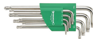
96432700 Set de tournevis coudés