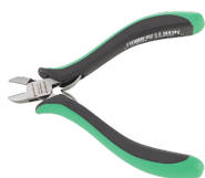
67086000 Cortaalambres «mini» para electrónica