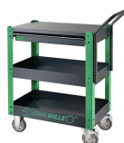
81300612 Trousse de service