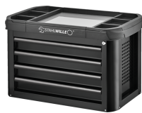
81200157 Cofre para herramientas