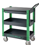
81300612 Carro auxiliar