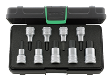
91332215 Satz Schraubendrehereinsatz