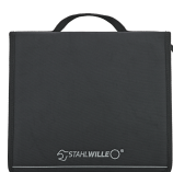
91101136 Coffret souple