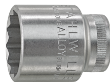
02410036 Douille pour tournevis