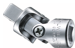
12020000 Joint de cardan