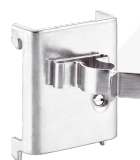
81485006 Pince à ressort