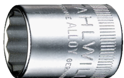
01530020 Douille pour tournevis