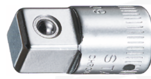
11030002 Douille à choc