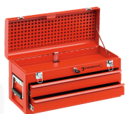
81091002 Valise à outils