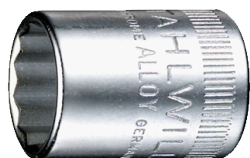
01530014 Douille pour tournevis