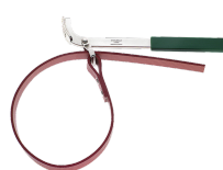
76500001 Clé à bande