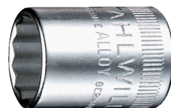
01530018 Douille pour tournevis