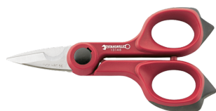
75270003 Cisaille à fil