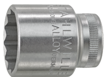
02410038 Douille pour tournevis