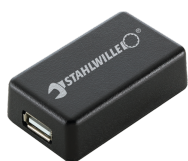
52110061 Adattatore di interfaccia