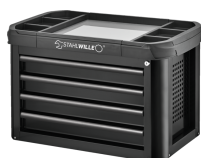
81200157 Skrzynka narzędziowa