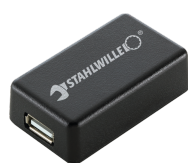
52110061 Adaptateur d'interface