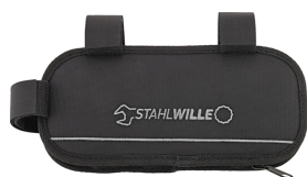
91101050 Sacoches pour cadre de vélo