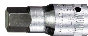
01120006 Douille pour tournevis INHEX