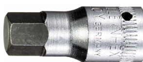
01120008 Douille pour tournevis INHEX